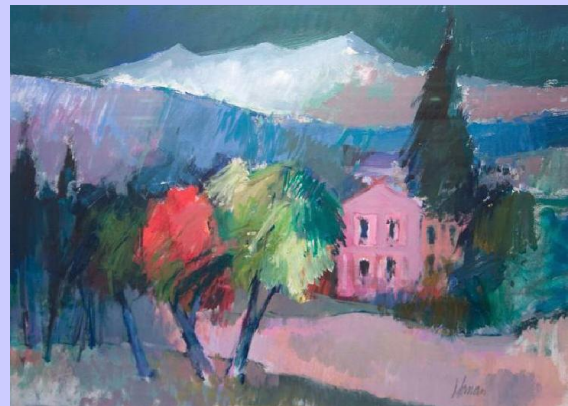
Werk van Jan Homan

Wanneer mogelijk laat Stichting De Ezelstal werken restaureren of (in)lijsten. Prioriteit ligt hierbij bij werken die aan actief verval onderhevig zijn. Daarnaast hebben werken die zijn uitgekozen voor de tentoonstelling in de eigen expositieruimte of op externe locaties voorrang.